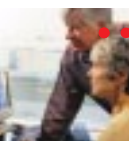
Table des matières